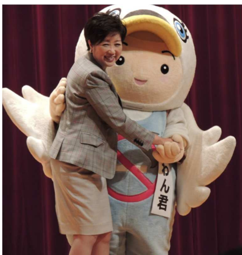
都知事挨拶のお礼のハグ (握手のつもりが、急きょこのように)