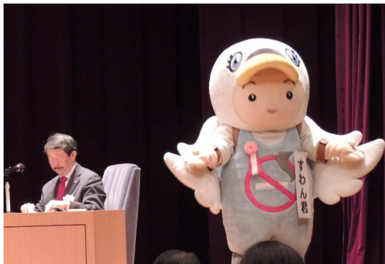
飯田先生の講演の最後にサプライズ登壇 (桃色のバラを胸につけて、ストップCVDをアピール)