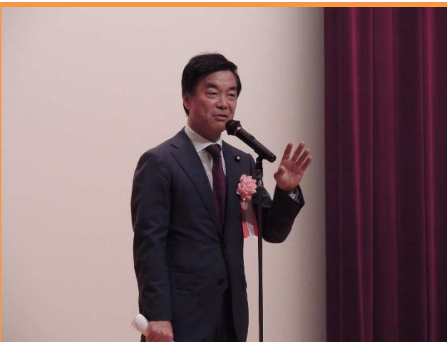
参議院議員 松沢成文 様

国会会期中のなか、駆けつけてくださいました。現在、健康増進法改正案の対案を野党と協力して作り始めていることを御紹介いただきました。