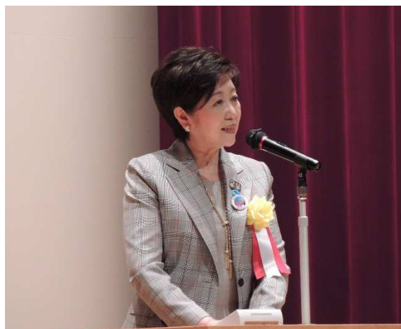
来賓挨拶 東京都知事 小池 百合子 様